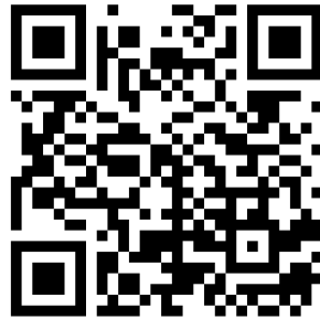
[ 구글 설문폼 ]