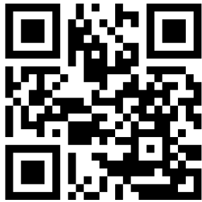
[ 네이버 설문폼 ]