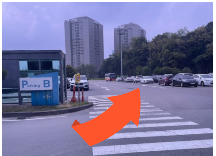
[ Parking B 주차장 ]