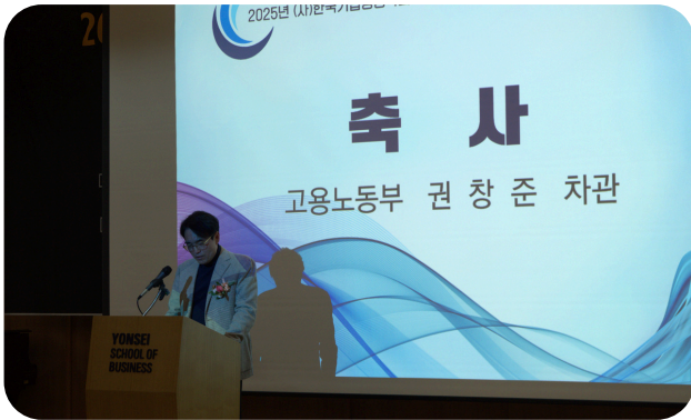
고용노동부 차관 권 창 준